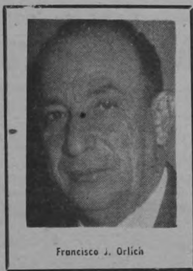
Francisco J. Orlich