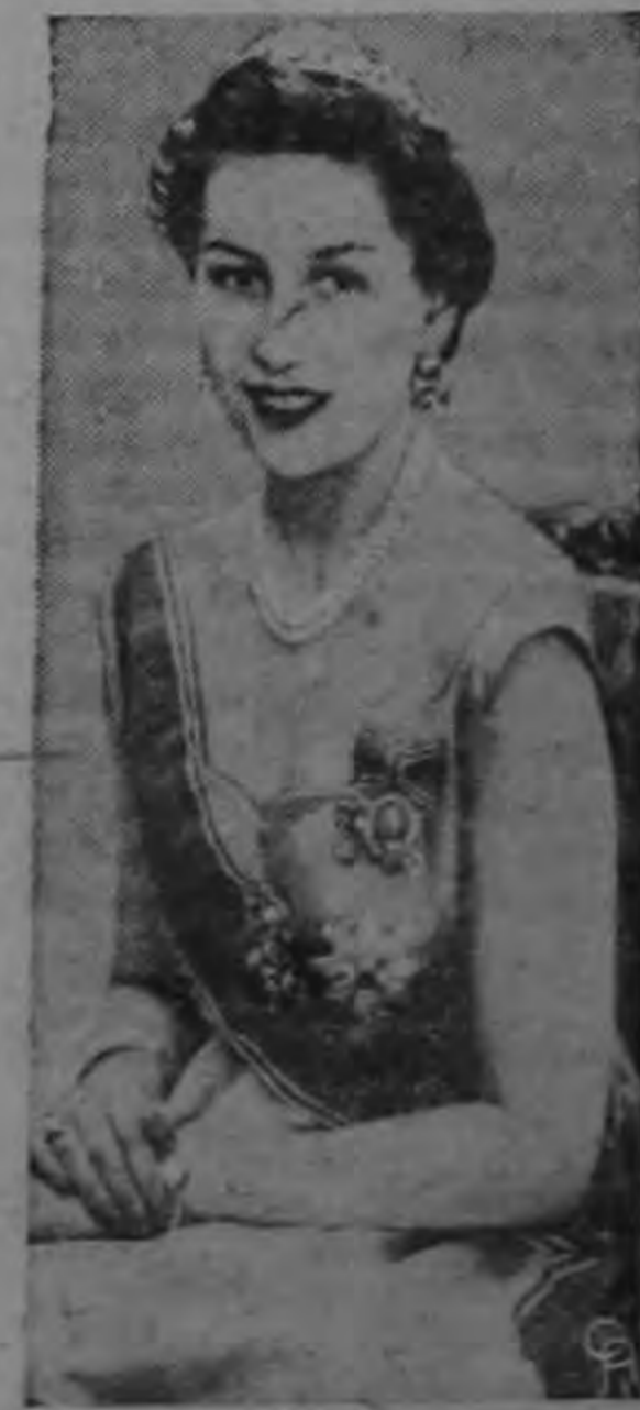
La Princesa Astrid de Noruega, retratada en Oslo al cumplir los 25 años en Skagumla, residencia de su padre el Principe heredero Olav.